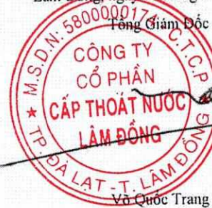
Vũ Quốc Trang