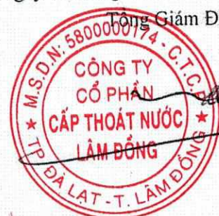
Võ Quốc Trang